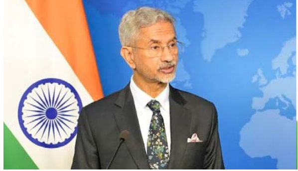
(સંપૂર્ણ સમાચાર સેવા) નવી દિલ્હી, તા. ૧૨ : ભારતના વિદેશ મંત્રી ડૉ. એસ. જયશંકરે ફરી એકવાર વૈશ્વિક મંચ પરથી અમેરિકા અને યુરોપના બેવડા વલણને પુલ્કુ પાડ્યું છે. કેમલેન્ડમાં આયોજિત એક કાર્યક્રમ દરમિયાન તેમણે રશિયા પાસેથી ઓઈલ ખરીદવાના મુદ્દે પશ્ચિમી દેશોને જવાબ આપ્યો હતો. તેમણે સ્પષ્ટ શબ્દોમાં અમેરિકાને સંભળાવી દીધું કે, તે

પરસવાલો ઉઠાવવામાં આવી રહ્યા છે, એ જ રશિયાને ઓઈલ ખરીદવા માટે એક સમયે અમેરિકાએ પોતે ભારતને આગ્રહ કર્યો હતો. વર્ષ ૨૦૨૨માં રશિયા-યુક્રેન યુદ્ધ શરૂ થયું ત્યારે વૈશ્વિક ઓઈલ બજાર તૂટી ન પડે અને કિંમતો કાબૂમાં રહે તે માટે અમેરિકાએ ભારતને રશિયા પાસેથી ઓઈલ ખરીદવા આજીજ કરી હતી. પરંતુ ત્યારબાદ જ્યારે ભારતે પોતાના રાષ્ટ્રીય હિતમાં ઓઈલની ખરીદી વધારી, ત્યારે અમેરિકાએ પહેલા ટેરિફ લગાવ્યા અને પછી પ્રતિબંધોમાં ઢીલ આપી. જયશંકરે અમેરિકાના આ વલણ પર કટાક્ષ કરતા કહ્યું કે, આમાં કોઈ મોટો સિદ્ધાંત નથી, આ બધું ઓન-ઓફ જેવું છે. જ્યારે તમને સૂટ થાય ત્યારે બધું સાચું અને ન સૂટ થાય ત્યારે ખોટું! અમે બધા સમજદાર છીએ અને આ રમત જાણીએ છીએ.