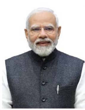
(સંપૂર્ણ સમાચાર સેવા) નવી દિલ્હી, તા. ૧૨ : પ્રધાનમંત્રી નરેન્દ્ર મોદી ૧૩થી ૧૮ જૂન દરમિયાન ફ્રાન્સની મુલાકાતે છે. તેઓ ૧૩-૧૪ જૂન ૨૦૨૬ ના રોજ નાઈસ, ત્યારબાદ ૧૬-૧૭ જૂને એવિયન અને ૧૭-૧૮ જૂન ૨૦૨૬ ના રોજ પેરિસની મુલાકાત લેશે. ૨૦૧૪ પછી આ

પ્રધાનમંત્રી નરેન્દ્ર મોદીની ફ્રાન્સની સાતમી સત્તાવાર મુલાકાત હશે. ફ્રાન્સના રાષ્ટ્રપતિએ ૧૭થી ૧૯ ફેબ્રુઆરી દરમિયાન ભારતની મુલાકાત લીધી હતી. જે દરમિયાન બંને દેશો વચ્ચેના સંબંધોને ખાસ વૈશ્વિક વ્યૂહાત્મક ભાગીદારી સુધી પહોંચાવવામાં આવ્યા હતા. હવે પીએમ મોદી ફ્રાન્સની મુલાકાત લઈ રહ્યા છે. આ મુલાકાત ભારત અને ફ્રાન્સ વચ્ચે ઉચ્ચ-સ્તરીય સંવાદની ગતિને પ્રતિબિંબિત કરે છે. તેનો મુખ્ય હેતુ ઈનોવેશન, વિજ્ઞાન અને ટેકનોલોજી, અર્થતંત્ર, સાંસ્કૃતિક સંબંધો અને લોકો વચ્ચેના સંબંધોને વધુ મજબૂત બનાવવાનો છે. પીએમ મોદી, ફ્રાન્સના